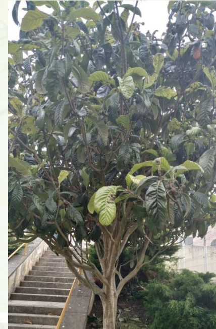
Foto de um detalhe da árvore