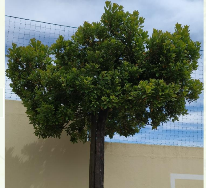
Foto de um detalhe da árvore