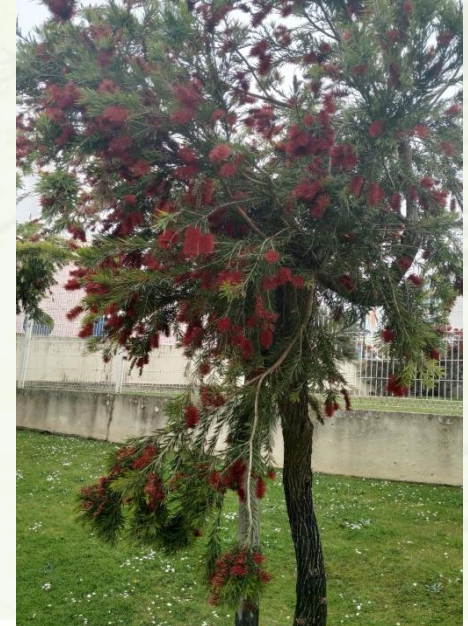
Foto de um detalhe da árvore