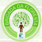
Foto da árvore