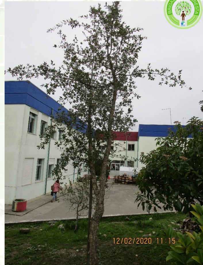
Foto de um detalhe da árvore