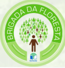
Foto da árvore