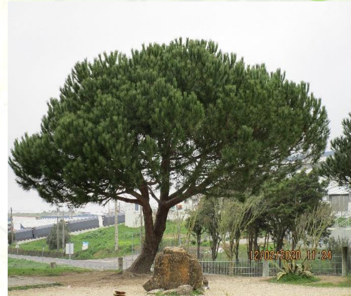
Foto de um detalhe da árvore