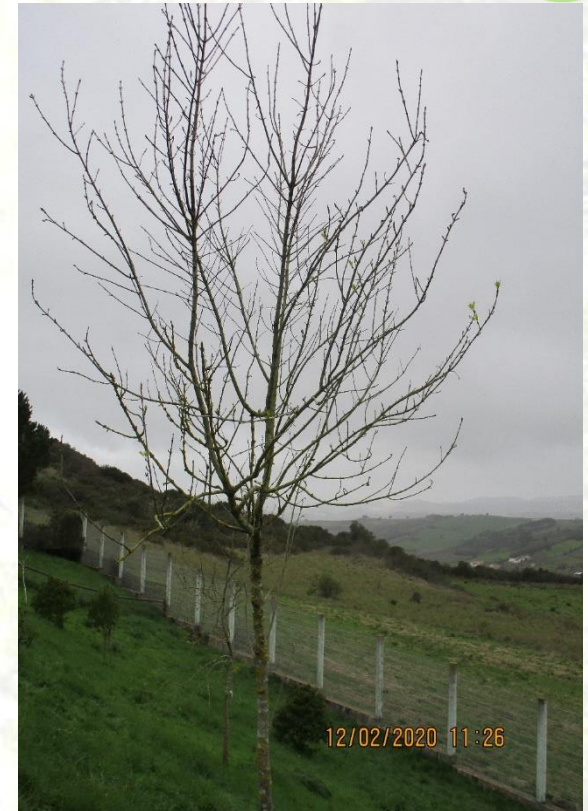
Foto de um detalhe da árvore