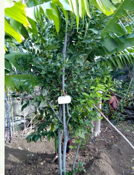
Foto de um detalhe da árvore