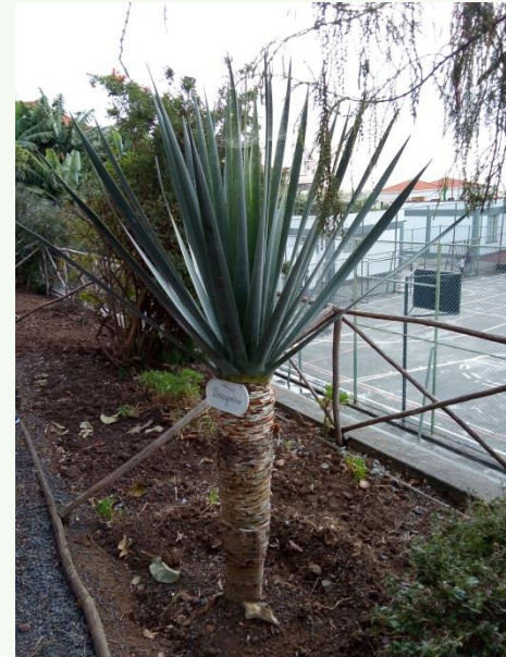
Foto de um detalhe da árvore