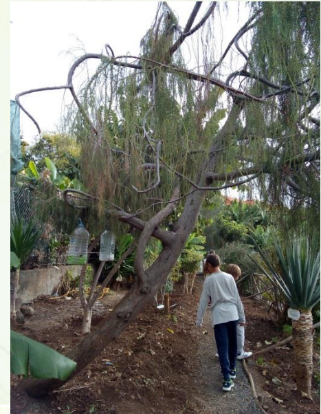
Foto de um detalhe da árvore