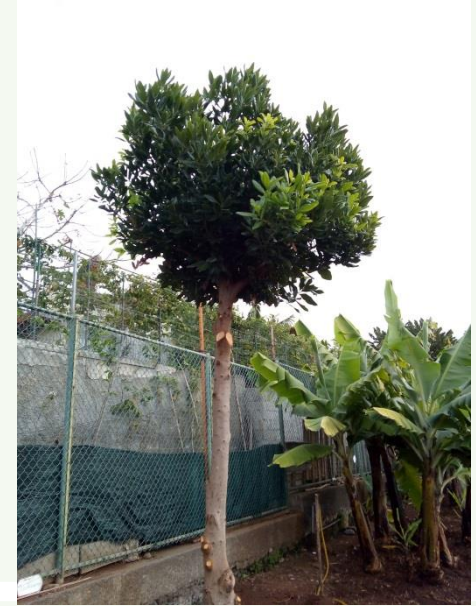
Foto de um detalhe da árvore