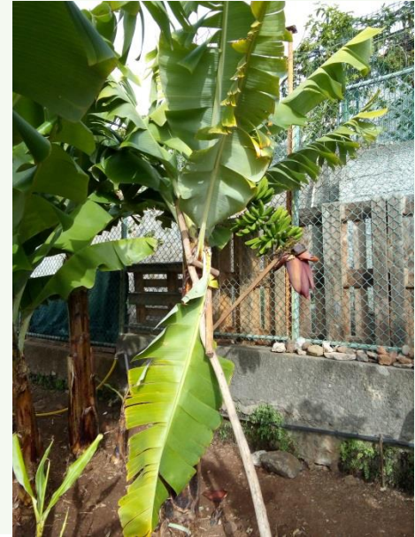
Foto de um detalhe da árvore