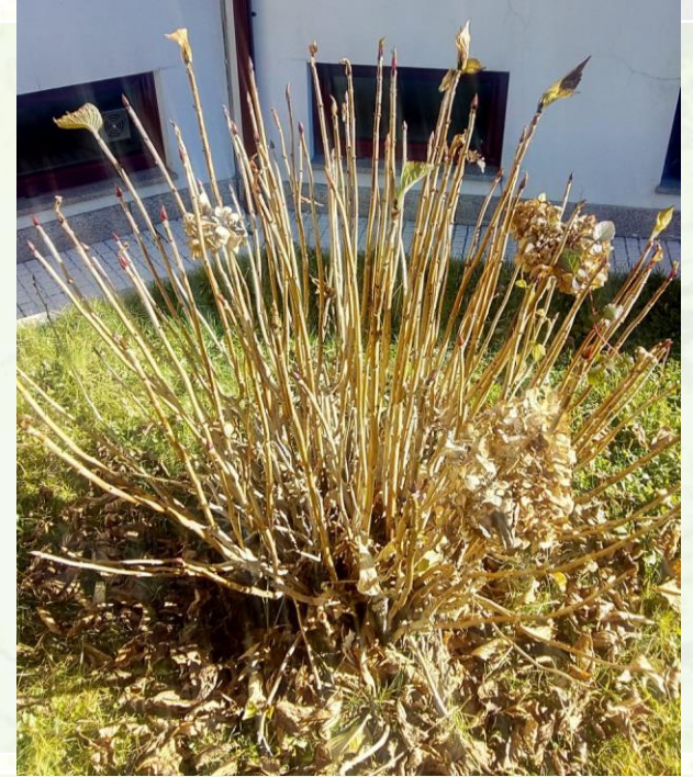
Foto de um detalhe da árvore