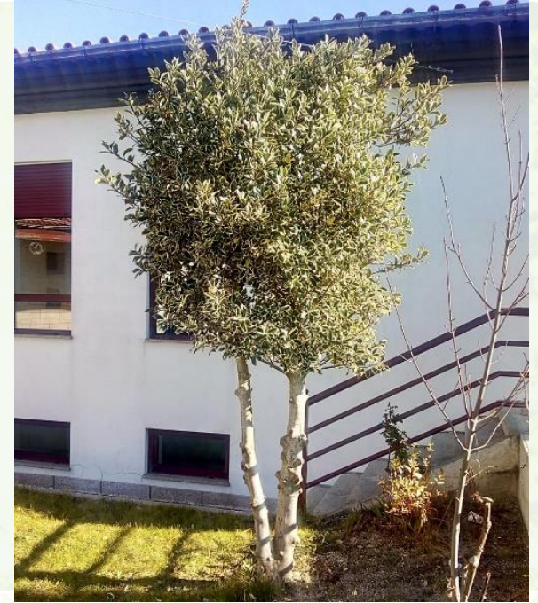
Foto de um detalhe da árvore